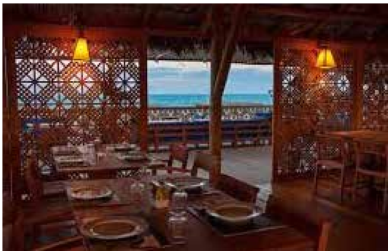
Restaurante Hotel Jaguaribe Lodge