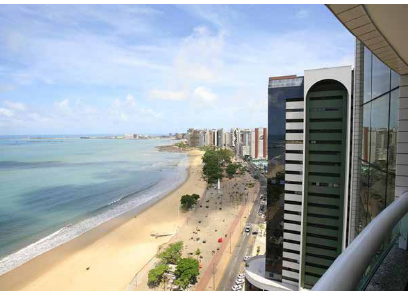
Vista do Hotel Luzeiros - Fortaleza