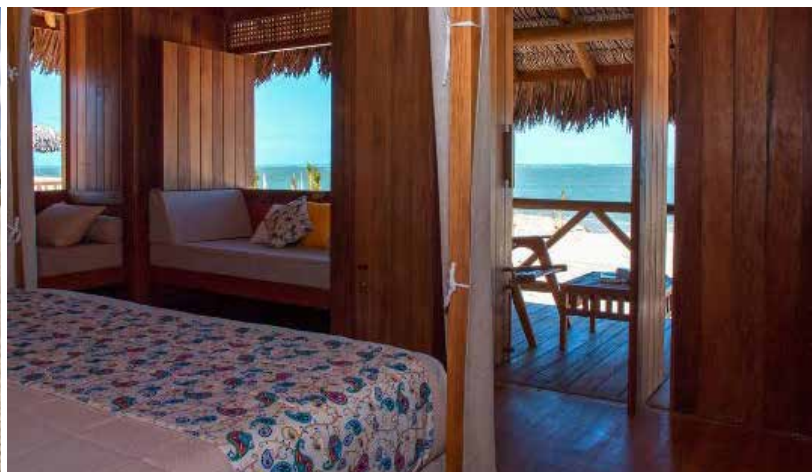
Quarto do Hotel