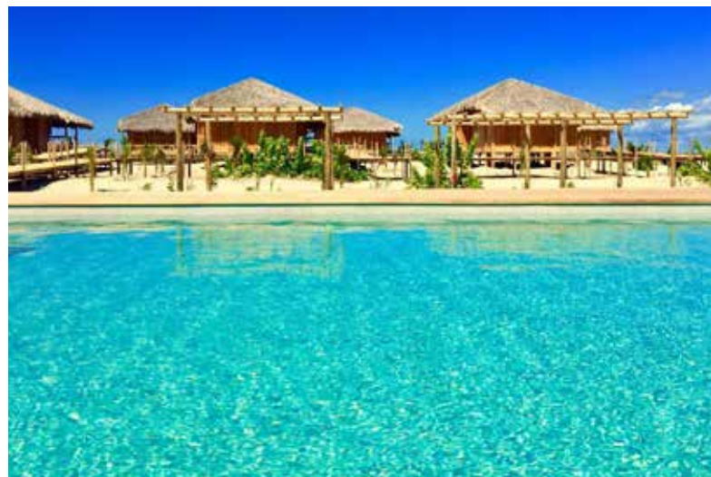
Piscina Hotel Luzieiro