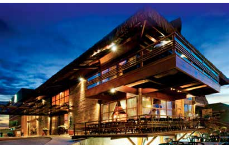
Restaurante Coco Bombu - Fortaleza

Tarde: Visita ao Museu do Ceará e ao Teatro José de Alencar, tombado pelo Instituto do Patrimônio Histórico e Artístico Nacional.