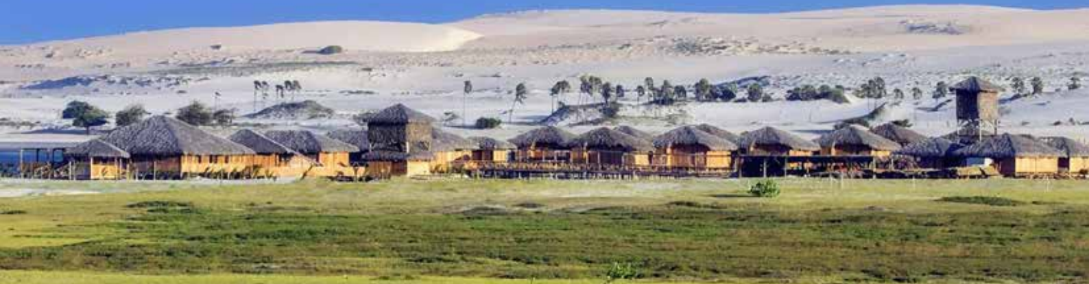
Hotel Jaguaribe Lodge - Fortim