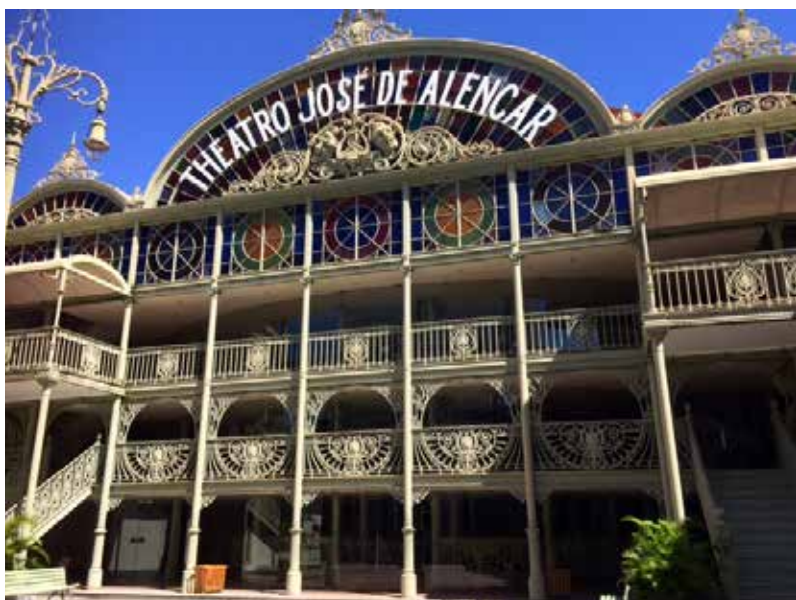
Teatro José de Alencar