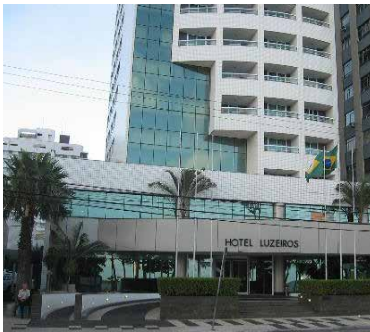
Fachada Hotel Luzeiros