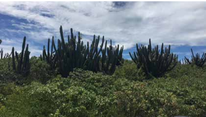
Plantação de Mandacaru

Manhã: passeio pela região de Fortim, de buggy, pelas dunas, praias de Fortim e plantação de mandacaru (opcional).