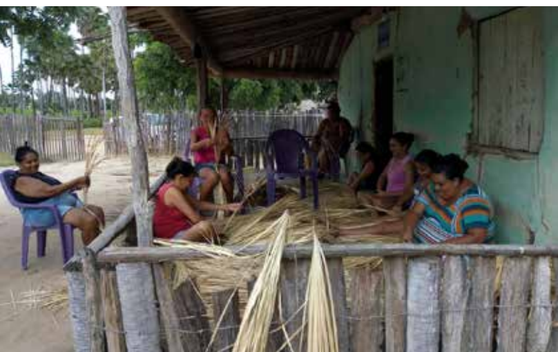
Artesãs trabalhando com a palha de carnaúba