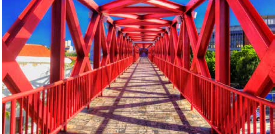
Dragão do Mar