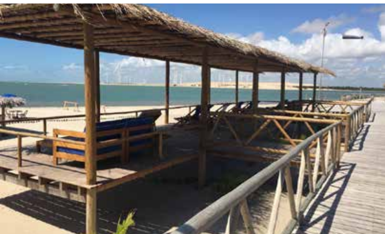
Vista dos quartos para o mar