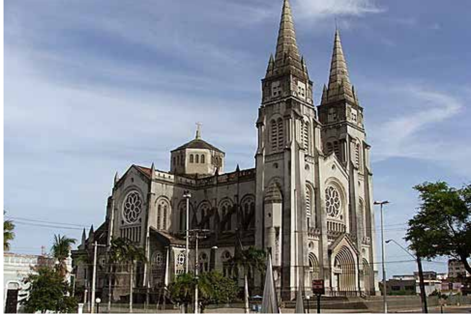
Catedral Metropolitana de Fortaleza