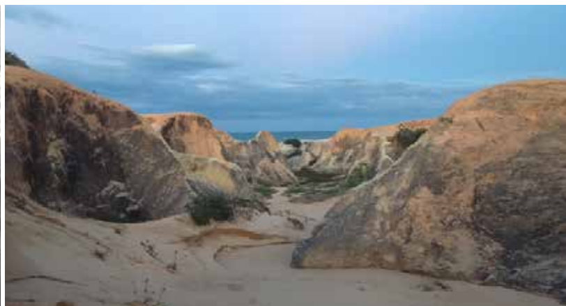
Monumento Natural das Falésias