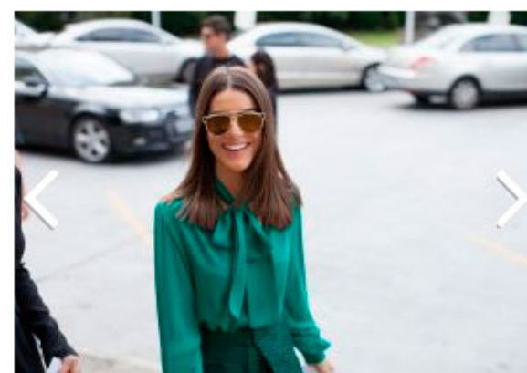
Os melhores cliques fora das passarelas do terceiro dia de SPFW