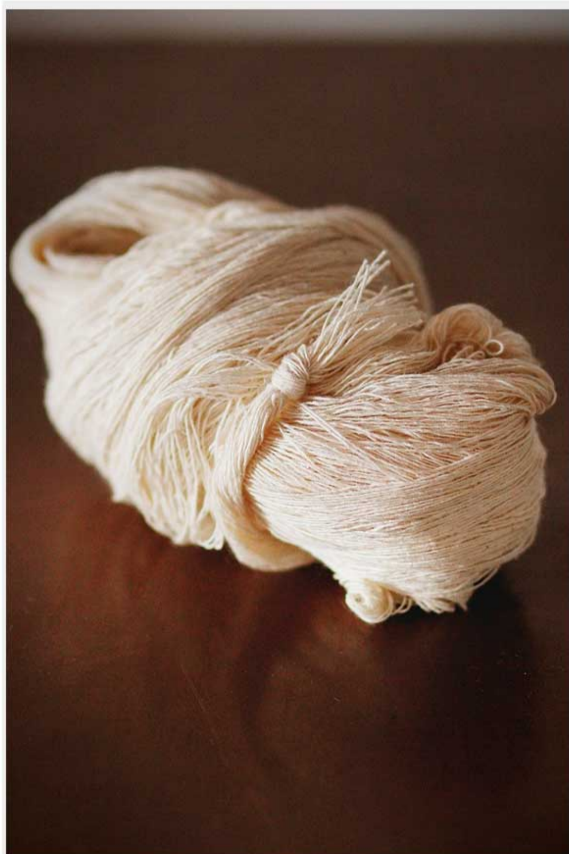
Algodão da Associação da Cultura Artesanal de Poço Verde