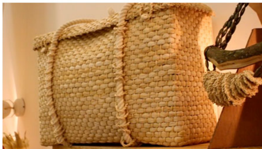
Bolsa e colar produzidos com artesanato sustentável

A Casa – Museu do Objeto Brasileiro, em parceria com a consultora de moda sustentável Chiara Gadaleta Klajmic, apresenta a exposição “Mãos do Meu Brasil: Artesanato Sustentável”, que reunirá cerca de 20 objetos, entre roupas e acessórios, desenvolvidos pela Associação Art D’Mio, de Brás Pires-MG, e pela Central Veredas, de Arinos-MG. A exposição tem como objetivo estabelecer uma troca entre comunidades artesãs e o mercado da moda, onde as comunidades aprendem técnicas de criação e confecção, enquanto suas produções artesanais são disseminadas no grande circuito da moda brasileira. exposição acontece até 12 de setembro.