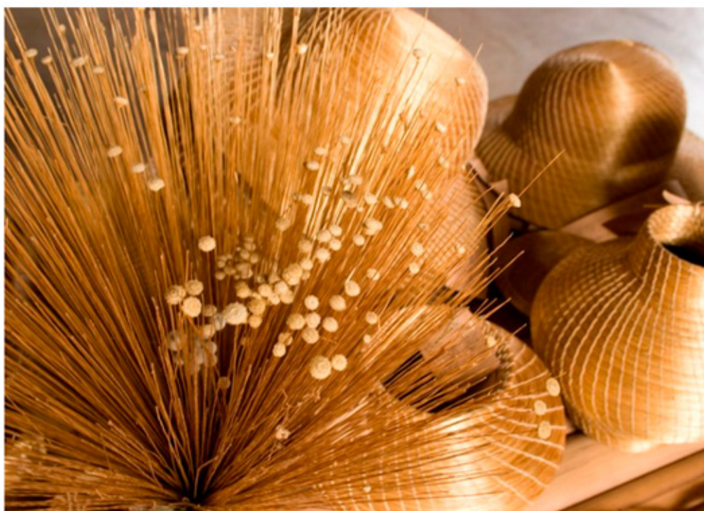
A beleza do capim dourado se presta a múltiplos objetos de artesanato

Vem do Tocantins a exposição Capim Dourado: costuras e trançados do Jalapão , que entrará em cartaz na A CASA ? Museu do Objeto Brasileiro. Trata-se de uma oportunidade para conhecer melhor um artesanato produzido naquele Estado e bastante valorizado no Brasil e no exterior.