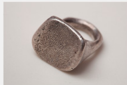
Joia Contemporânea Brasileira: Percurso