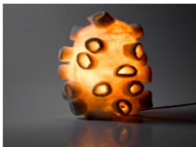
(Lucas Moura) Anêmona

São Paulo - A coleção Lã em Casa do grupo de Artesanato Ladrilã está expondo suas peças na A Casa - museu do objeto brasileiro - desde o dia 5 de junho. Os interessados em conhecer o trabalho das artesãs gaúchas tem até o dia 2 de agosto para realizar a visitação, que ocorre das 12h às 16h. A Casa fica na rua Cunha Gago 807, em São Paulo. Mais informações podem ser obtidas pelo site: