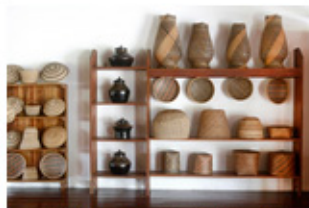
Loja Wand, em São Gabriel da Cachoeira, AM