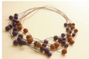
Colares de fibra lucum de São Gabriel da Cachoeira, AM