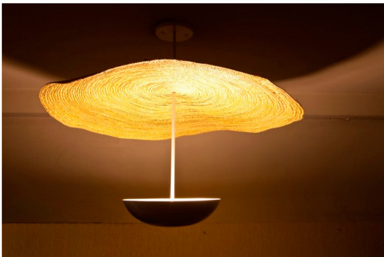
Luminária de Tina Moura e Lui Po Pumo, feita com palha de artesãos gaúchas

Ao contrário de países como a Itália, no qual a tradição artesanal fez parte do desenvolvimento do design, no Brasil, o artesanato sempre foi visto como uma atividade à parte. A partir de meados da década de 1990, porém, design e artesanato se aproximam, e essa reconciliação gera bons frutos.