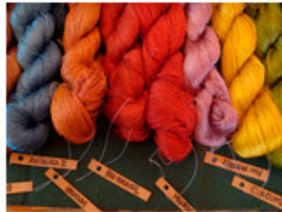
Fios tingidos com plantas diversas