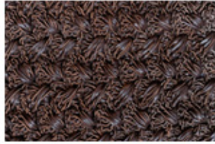
Crochê de fibras de couro da Coope-Roca, Rio de Janeiro