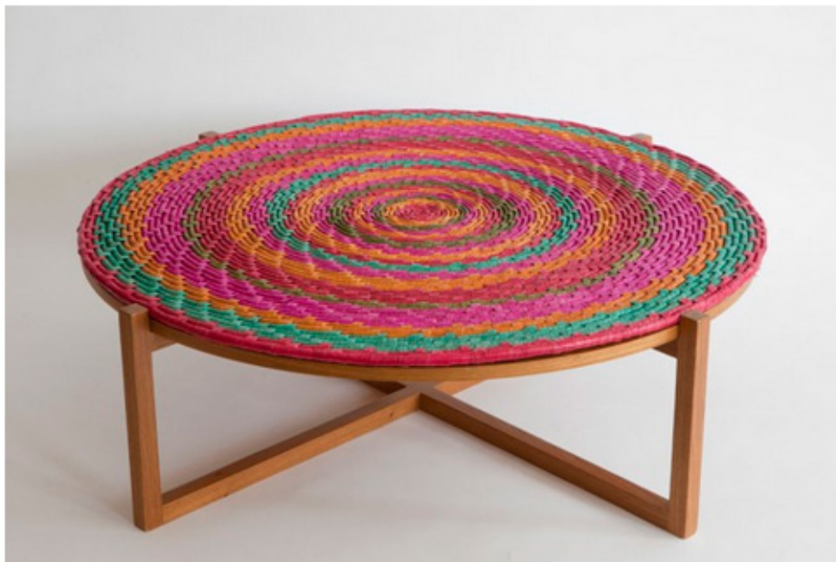
Mesa Mandala, de Claudia Moreira Salles, com centro trançado