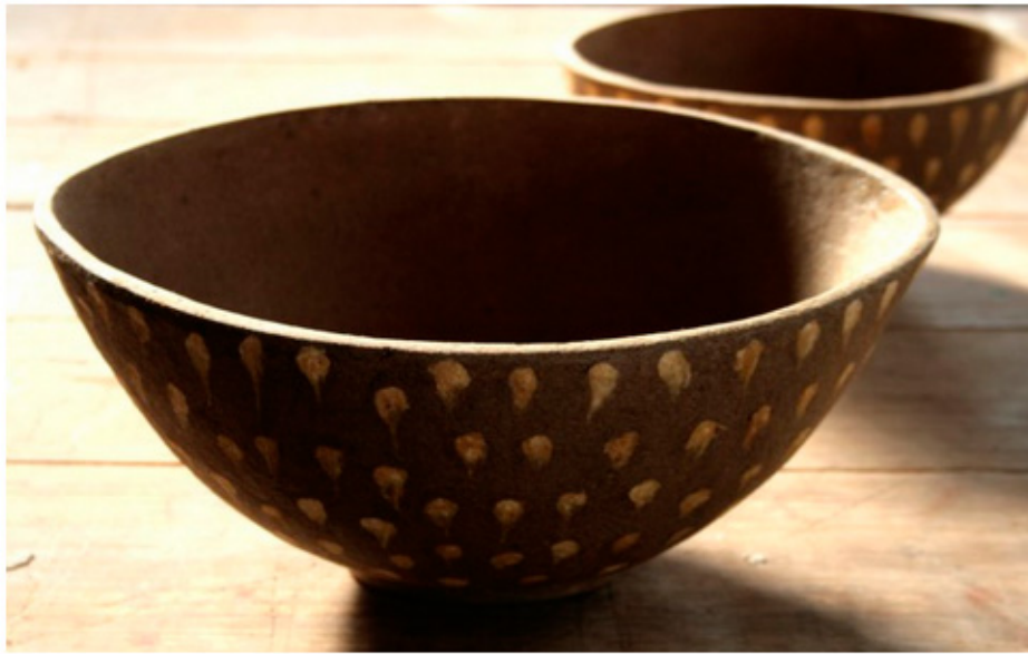
Objetos de papelão e fibra, de Maria da Fé, MG

(Clique em qualquer uma das imagens para vê-las ampliadas em galeria)